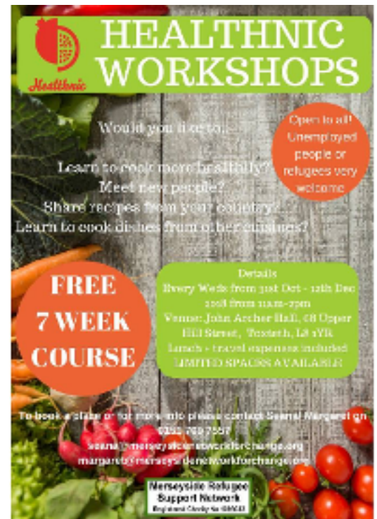
Poster di promozione dei laboratori healthnic di Liverpool/GB