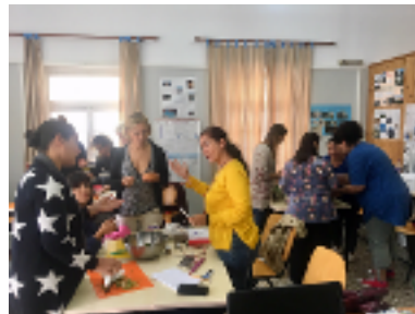
Laboratorio healthnic in Grecia

Visita il sito healthnic.eu , leggi le notizie sui laboratori e guarda le storie create dai partecipanti.